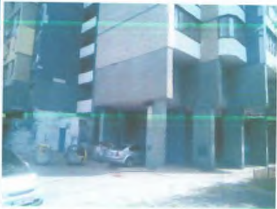
ВХІД ДО ОЦІНЮВАНИХ ПРИМІЩЕНЬ