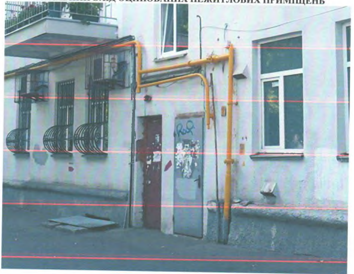
ПРОХІД ДО ОЦІНЮВАНИХ НЕЖИТЛОВИХ ПРИМІЩЕНЬ