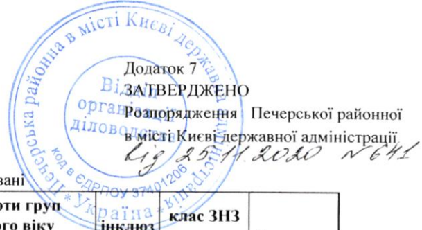
Мережа закладів дошкільної освіти загального типу, компенсуючого типу, комбіновані